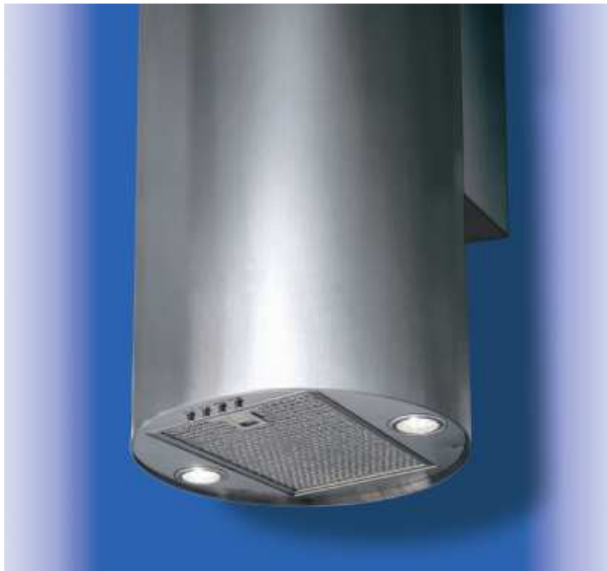
Hotte Décor Murale « NAUTILUS » Ø 40 cm HD 507 I – Inox Code EAN : 8026493043057

Hotte mixte livrée avec les filtres charbon Pour le recyclage de l'air, monté d'origine Evacuation supérieure Ø 150 mm Filtre à graisse périphérique en Inox, 1 moteur double turbine 135 Watts Eclairage par halogènes de 2 x 20 Watts Commandes par boutons Clapet anti-retour, Cordon de raccordement monophasé 230 V